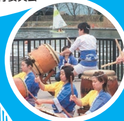
小型ヨット Access Dinghy