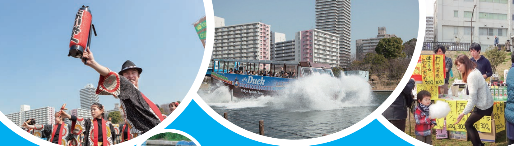
川床ステージは一日中楽しめます!

川辺の食べ物横丁にも売店が並び、この日ばかりは、ここが!!水辺ゆうえんちになります。